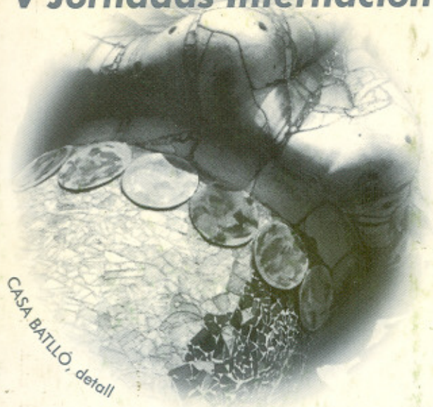
CASA BATLLÓ, detall

V Jornades Internacionals d'Estudis Gaudinistes V Jornadas Internacionales de Estudios Gaudinistas