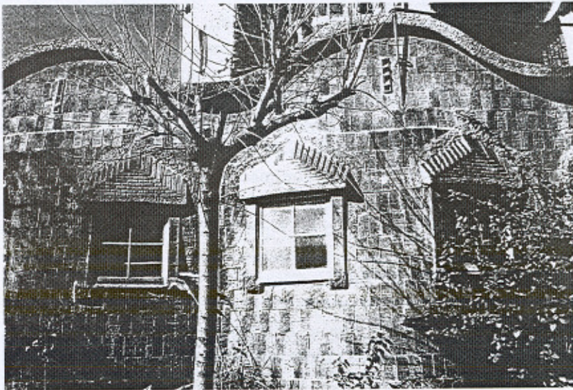
Fachada de la Escuela

La propuesta que se presenta de traslado, además de ser segura, sencilla, económica y original, plantea una nueva ubicación y uso que permitirán resaltar la obra en el entorno de la Sagrada